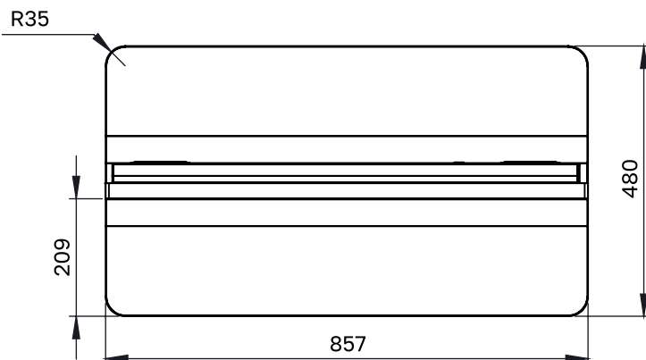
СХЕМА ДИСПЛЕЯ (ВИД СВЕРХУ)