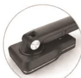
Полностью складная конструкция