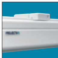
Система Easy Install