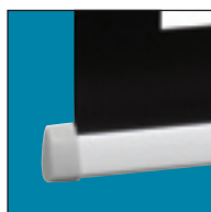
Треугольная нижняя планка