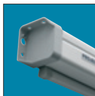
Встроенные монтажные кронштейны