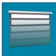
Полный возврат с помощью CSR