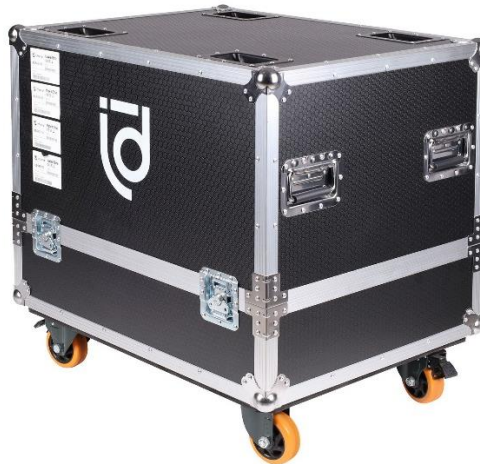
Флайт-кейс для спутников

В комплект также входит коммутация для соединения с сабвуфером, линк-кабели для спутников, стойки «саб-спутник», тканевый чехол для стоек и кабелей.