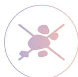
Устойчивость к плесени