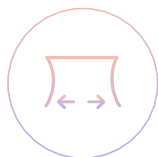
Боковое натяжение полотна