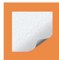
Угол обзора 160° Усиление 1

Универсальное полотно с белой матовой поверхностью на текстильной основе с покрытием ПВХ. Равномерное распределение света исключает появление горячих пятен и изменение цвета. Благодаря широкому углу обзора перед экраном может разместиться большое количество зрителей.