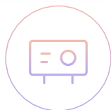
Совместимы с короткофокусными и ультракороткофокусными проекторами