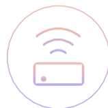
Дистанционное управление в комплекте