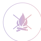
Устойчивость к огню